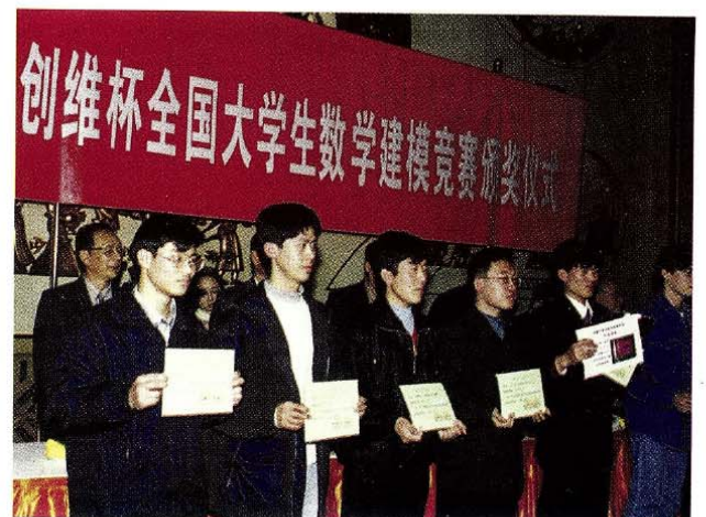
获奖同学代表领奖