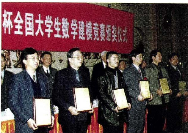
获组织工作优秀奖的赛区代表领奖