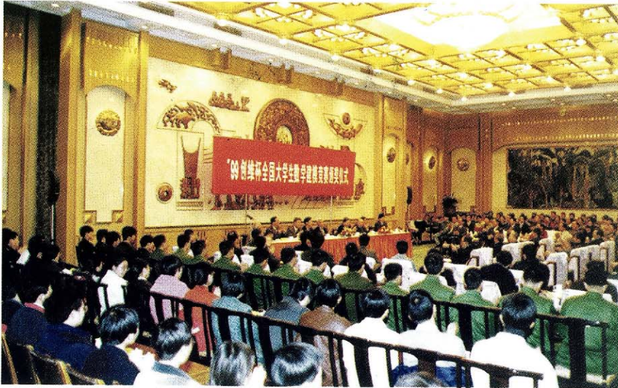
◀ 颁奖仪式在人民大会堂云南厅举行